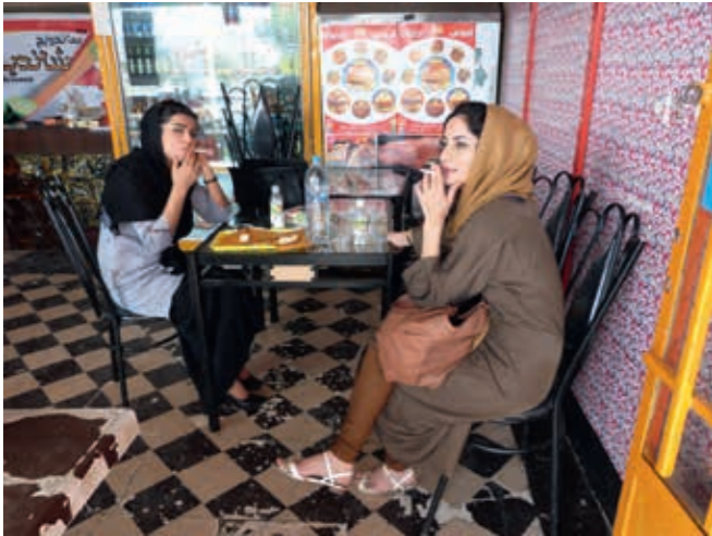
Projekt 2012: Picknick in Persien. Autobahnraststätte Foto auf Kunststoff, 60 x 80 cm

Es ist das Gesamtwerk von BEATE PASSOW, das in seiner konsequenten Haltung die Jury überzeugte. Sie zeigt mit ihrer radikalen, politischen Kunst, die in der heutigen Zeit angesichts der starken Veränderungen in der Parteilandschaft und im globalen Gefüge bewusst werden lässt, wie wichtig es ist, die Historie auch in der Kunst zu befragen.