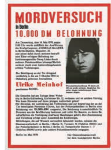
Aus der Serie: WANTED 2016/2017. Ulrike Meinhof. NSU-Terror Stickerei und Foto auf Stoff, je 90 x 120 cm

BEATE PASSOW has been doing this all her life. It is not by chance that her year of birth 1945 is influencing her artistic socialization. She started her studies with painting, but very early turned to photography, following her dedicated observations. A medium which adequately transports her political view on social phenomena. For this she is not using only one visual program.