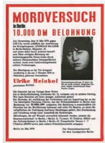
Aus der Serie: WANTED 2016/2017. Ulrike Meinhof. NSU-Terror Stickerei und Foto auf Stoff, je 90 x 120 cm

BEATE PASSOW has been doing this all her life. It is not by chance that her year of birth 1945 is influencing her artistic socialization. She started her studies with painting, but very early turned to photography, following her dedicated observations. A medium which adequately transports her political view on social phenomena. For this she is not using only one visual program.